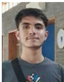
لباس میرزایی کابل افغانستان

توجه و علاقه به پوشاک سنتی افغانستان نه تنها در میان مردم افغانستان، بلکه در بین اتباع افغان مقیم خارج نیز افزایش یافته است. مردمی که با وجود زندگی در خارج از افغانستان، هنوز با لباس های سنتی در مراسم خاص ظاهر می شوند. این بدان معناست که صنایع دستی افغانستان هنوز هم طرفداران زیادی دارد. با توجه به تنوع فرهنگی و قومیت های متعدد در افغانستان مد افغانی به عنوان یک میراث فرهنگی غنی شناخته می شود. این مد شامل فرهنگ سنتی است که در سرتاسر این سرزمین گسترش یافته است. فرهنگ افغانی با توجه به تنوع قومیت ها مانند پشتون، تاجیک، هزاره، ازبک، بلوچ، ترکمن و گورجار، شاخصه های فرهنگی متعددی را به تصویر می کشد. لباس افغانی نیز تأثیرات مناطق و فرهنگ های مختلف را در خود جای داده است و تنوع رنگ و طرح در این لباس ها نشانگر تنوع فرهنگی و قومی در این سرزمین است