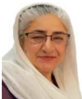
فوزيه شهاب دافغانستان ملي راډيو تلويزيون پخوانی نطقه

يوې بلې طبي څېړنې ښودلې ده چې د قهوهې څښل نه يواځې د زړه روغتيا تضمينوي، بلکې د زړه حملې او د زړه د دريدو د ناروغيو خطر هم کموي. خو دا بايد په ياد ولرو چې په قهوه کې موجود کافين د وينې په فشار اغيز کوي، نو د طبي موندنو پر بنسټ هغه کسان چې د وينې فشار لري بايد د قهوهې مصرف سره احتياط وکړي. همدارنگه ډاکټران سپارښتنه کوي چې ځينې خلک، په ځانگړې توگه ميندواړه مېرمنې، ماشومان او ټنکي ځوانان د قهوهې په څښلو کې محتاطه