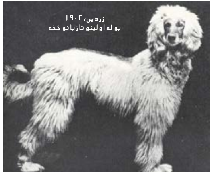
زردین، ۱۹۰۲ یو له اولینو تازیانو څخه

د افغانستان په واورو پوښل شویو غرونو کې د زمي ښکار د کړندې او هوښیار افغان هونډ سره پیل کېږي، دا د سپي نسل د دوی د ځیرکتیا او هوښیارتیا لپاره پیژندل کېږي. نرې وړاندوینه کېږي وه چې دا تکړه ملګري چې د خپل ښکار د مهارت له امله ویاړي، د برتانوي استعماري افسرانو زړونه به خپل کړي تازي هماغه تازي سپي دی چې مور یې نن د د افغان هونډ په نوم پیژنو.