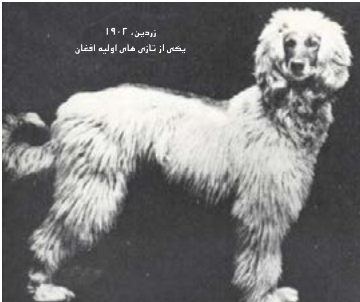
زردین، ۱۹۰۲ یکی از تازی های اولیه افغان

غرب تثبیت کرد. در قلمرو پرورش سگ، سگ افغانی به عنوان یک نژاد منحصر به فرد و باستانی خودزمایی می کند. مطالعات ژنتیکی موقعیت پایه آن را در شجره خانواده سگ نشان می دهد و بر میراث متمایز آن در خارج از اروپای غربی تأکید می کند. شیوه های انتخابی پرورش و نظافت در قرن گذشته، سگ تازی افغان را به همدمی برانزده و ابریشمی که امروزه می شناسیم، تبدیل کرده است