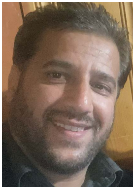
هارون سافي سينټ لوئس

په پايله کې، په متحده ايالاتو کې د افغان کورنيو ځواکمنتيا په امريکايي ټولنه کې د دوی د بريالي ادغام لپاره اړينه ده. ټولنې کولی شي له دغو کورنيو سره مرسته وکړي چې خپل کلتوري ميراث ساتي او د دوی د بې سارې ننګونو په پيژندلو او هدفې ملاتړ چمتو کولو سره د کورنۍ اړيکې بيا وړې کړي. لکه څنګه چې موږ د خپل ملت تنوع لمانځو، دا اړينه ده چې موږ د پالنې چاپيريال چمتو کړو چې د افغان کورنيو په ګډون ټولې کورنۍ وده وکړي، او ډاډ ترلاسه شي چې د ټولنې بنسټيز رکن، کورنۍ، ثبات او مقاومت وکړي