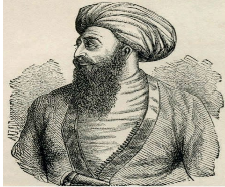
دوست محمد خان ۱۷۹۲ - ۱۸۶۳

د سینټ لویس اوسیدونکي ممکن د افغانستان د هغه وخت وضعیت څخه بی خبره وو چې د دوی د واقعیت سره یې ورته والی درلود. په نننۍ دوره کې د نړیوالو خبرونو څخه بی خبره پاتې کیدل خورا ستونزمن دي ځکه چې ټولنیزې رسنۍ، آنلاین خبرې سرچینې، او فوري پیغام رسونه شتون لري.